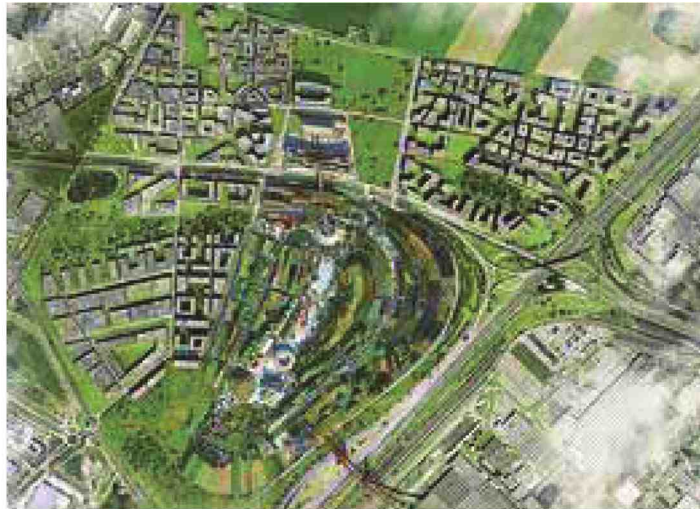
Les 299 hectares du Triangle de Gonesse, inclus un peu plus de 240 hectares de terres agricoles.

Ce travail d'adaptation devrait déboucher sur l'élaboration du per-